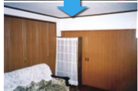
【洋間リフォーム例】