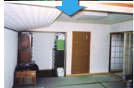
【和室リフォーム例】