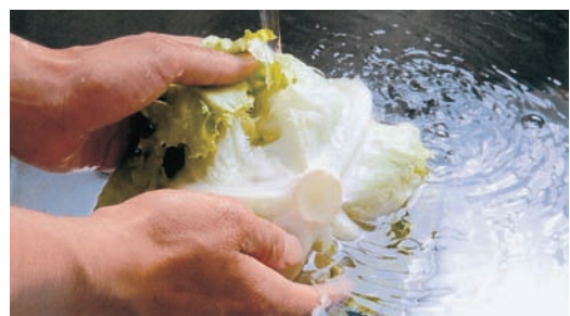
【食材の洗浄に使えます】