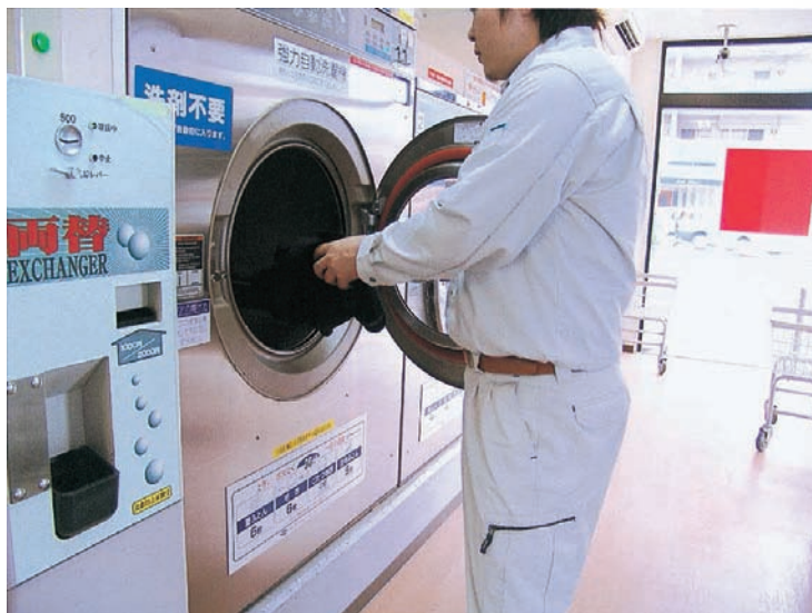
【コインランドリーでの使用例】