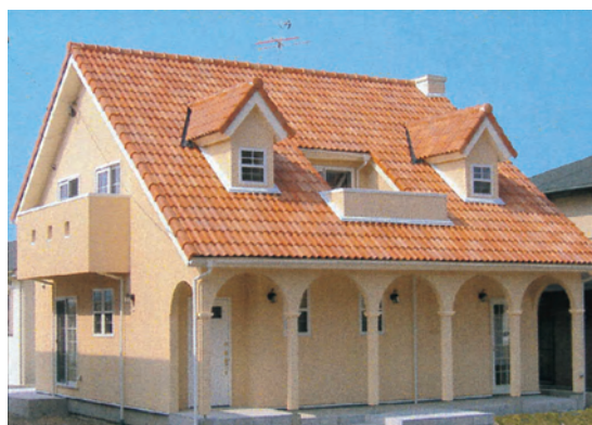
【プロヴァンスカラーの「ユーロベスト」】

アスベストの入った屋根材の改修工法「シールドサクシオン工法」を開発しました。アスベストを完全に吸い取り、現場周囲に飛散させません。