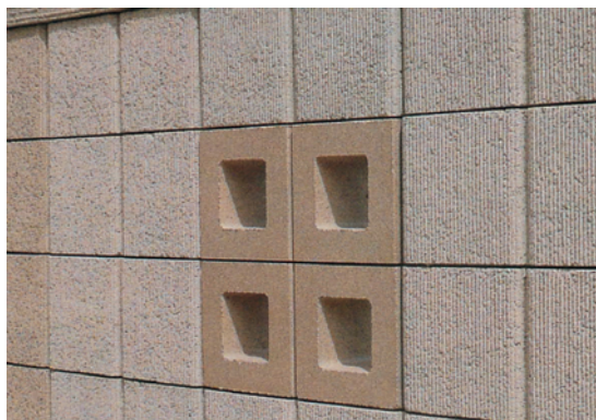
【ハイブリッド塗装ブロック「ポーセラム」】

★安全施工・責任施工をモットーに努力を続けております。見積りは無料ですので、お気軽に当社までお問い合わせ下さい。