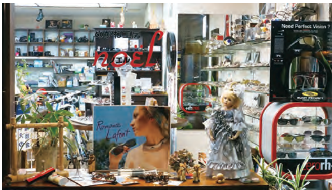
アンティークな店内には600本の眼鏡達が貴方を変身させようと並んでいます♪

『掛けるだけでワクワクする眼鏡』『快適に見える眼鏡』『快適な掛け心地の眼鏡』『補聴器できこえのお手伝い』ノエルは『一期一会』の心でおもてなしいたします。