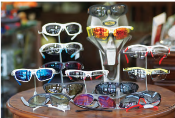
ゴルフや野球等、スポーツサングラスの度付も承ります。