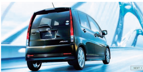
【若者に大人気の「ムーヴ」(写真はカスタム)】

県内18店舗（うち、中古車販売のカーメイト店が5店舗）体制でサービス網も充実しており、お客様に信頼され、安心して気軽にお越し頂けるようなお店づくり及び社員（全社員）への意識づけを行っています。